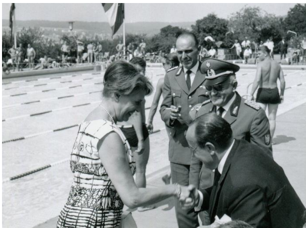
Polizeimeisterschaft im Schwimmen (Terrassenbad in Bad Kissingen)