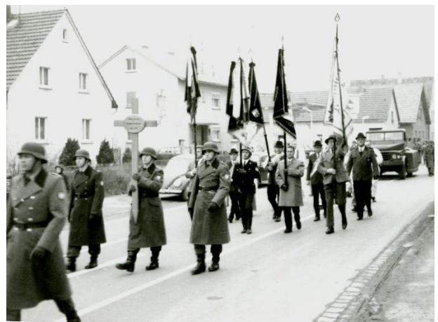
Auf dem Weg zum Friedhof