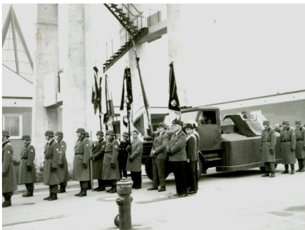
Aufstellung des Trauerzuges / Ehrengelcit