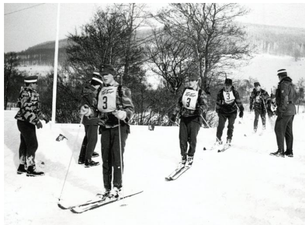
Wettkampf im Grenzsteifen-Skilauf in der Rhön