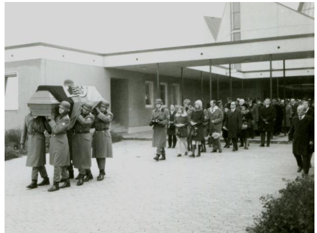
Auszug aus der Kirche