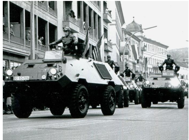
Paraden bei den deutsch-amerikanischen Freundschaftswochen in Bad Kissingen