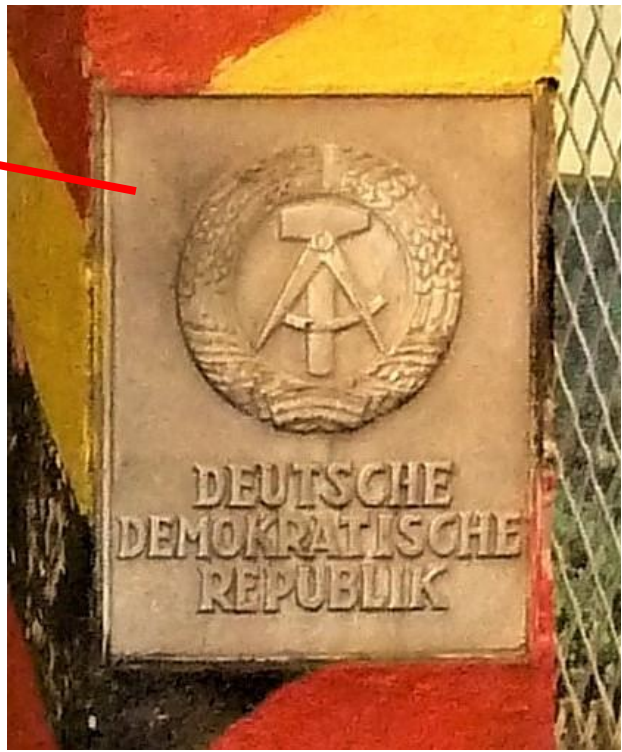
Grenzsäule der DDR (schwarz – rot – gold) mit Emblem „Indianer“